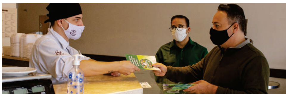
Acita lança e distribui Protocolo Simplificado para reabertura do comércio

Há quase 90 dias com restrições, comerciantes retomam atividades gradualmente em junho.