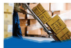
Coleta e Distribuição